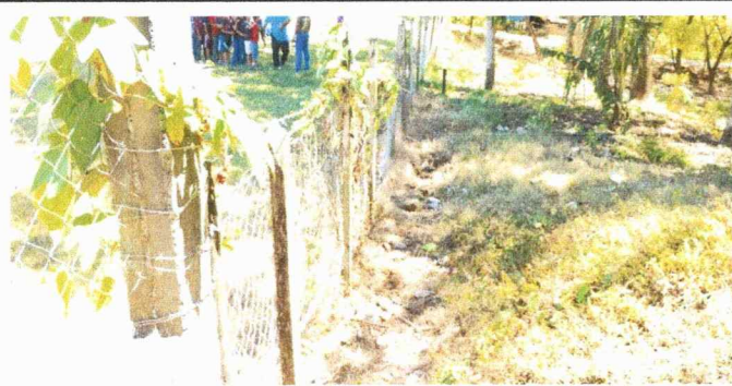
Foto 5: Mantenimiento de la cirulacion del centro educativo.